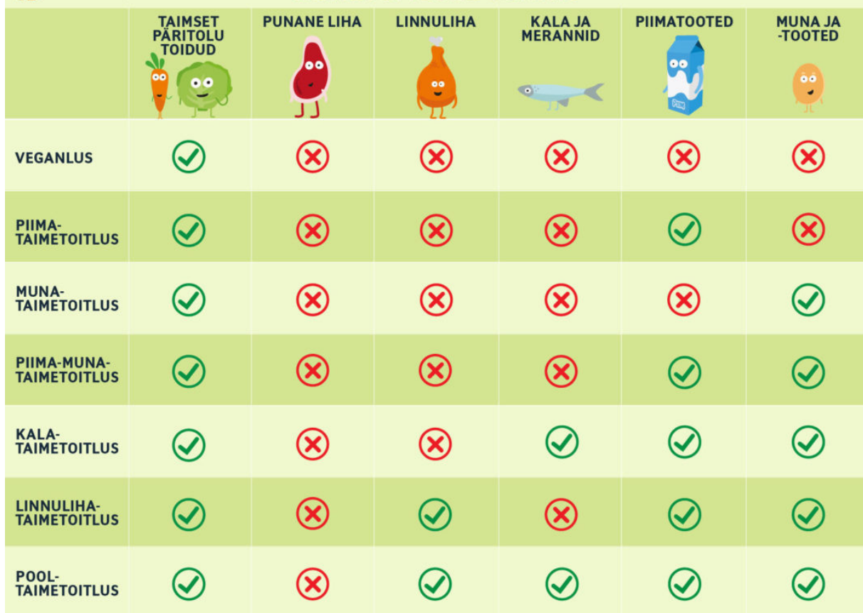
Joonis 1. Taimetoitluse vormid (Taimetoitlus).

Joonisel 1 on esitatud taimetoitluse erinevad vormid, mis eristuvad selle alusel, milliseid loomset päritolu toiduaineid toitumises kasutatakse või välditakse. Sõna taimetoitlus võib olla eksitav, kuna see ei tähenda alati ainult taimsete toitute tarbimist. Tegelikult hõlmab taimetoitlus erinevaid toitumisviise, mille puhul loomsete saaduste kasutamine võib erineda, samas kui veganlus välistab kõik loomset päritolu tooted. (Taimetoitlus).